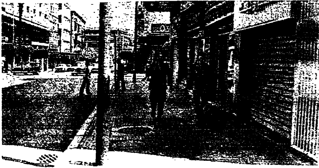
حوريف من رجال الأمن يمشي في شوارع بيروت

التامة من الخلل . اقفال المصارف واستمر اقفال المصارف ، رغم ان بعضها فتح ابوابه لفترة قصيرة تسمى الصباح ، لكن عدم حضور الزبائن أدى الى اقفالها من جديد كلاك تحت بعض شركات السياحة والسفر ابوابها ، ومطعم القاهي والمطعم في شارع الحمراء حيث ازديحت زبائن . اما شركات القطاع الخاص ، فقد استلقت قسم منها اصعاقه بمسورة جزية حتى الظهر ، واقصر العمل على المعاملات المكسة ، دون وجود أي نشاط تجاري ملحوظ . وشهدت المحلات التجارية التي تحت ابوابها امس ، توتفنا كثيرا من المواطنين على شراء المواد الغذائية مما أدى الى نقص ملحوظ في الكميات المعروضة ، وتمتد نسبة فتح المحلات ١٠ و ٢٠ بالمئة . بينما كان اقفال شلالا في شوارع عديدة ، خاصة في قلب المدينة . وبالنسبة لحركة السير ، كانت خفيفة في ساعات الصباح ، واقترت الشوارع من السيارات والمارة منذ فترة الظهر . ولوحظت حركة شبه عادية في سوق الخضار ، حيث كانت السيارات الكثيرة تنزع حولتها من الخضار والفواكه لنهاية تلبية لطلبات المحلات والمستهلكين .